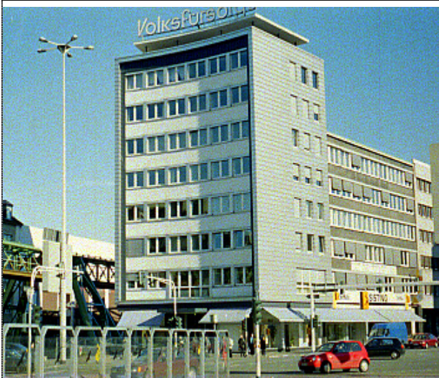
WESTFRONT MORIANSTRASSE >